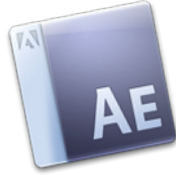
Adobe After Effects